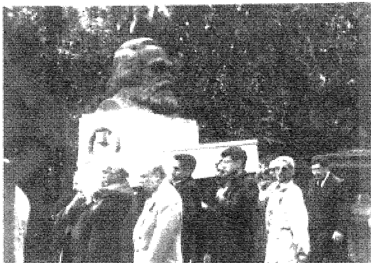
مراسيم تشييع جثمان الفقيد ابو سعد في مقبرة الهاي كيد ١٩٩٨/٧/٣١